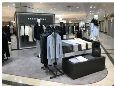
セオリーリュクス