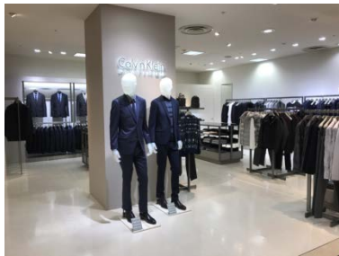
カルバンクラインプラティナム