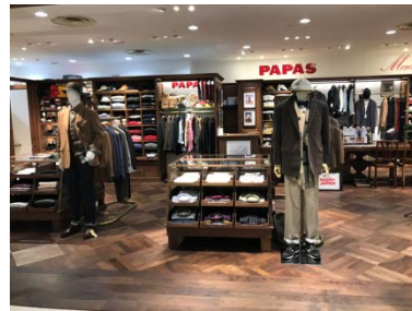
パパス・マドモアゼルノンノン