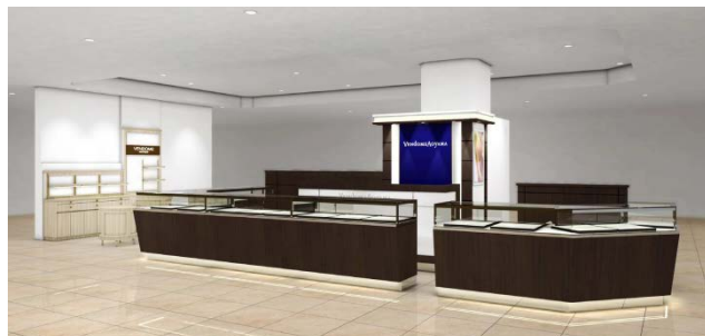
ヴァンドーム青山 ※パースイメージ