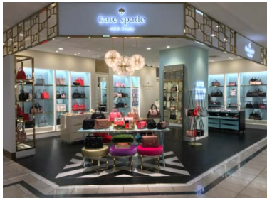
ケイト・スペード ニューヨーク