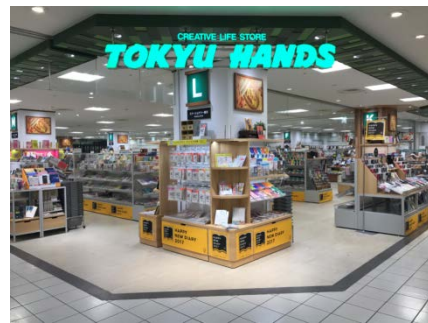
東急ハンズ奈良店

「東急ハンズ」事業のフランチャイズ形態直営事業化 第1号店舗であり、奈良県初出店となる「東急ハンズ奈良店」を新規導入