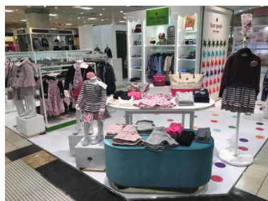
ケイト・スペード ニューヨーク