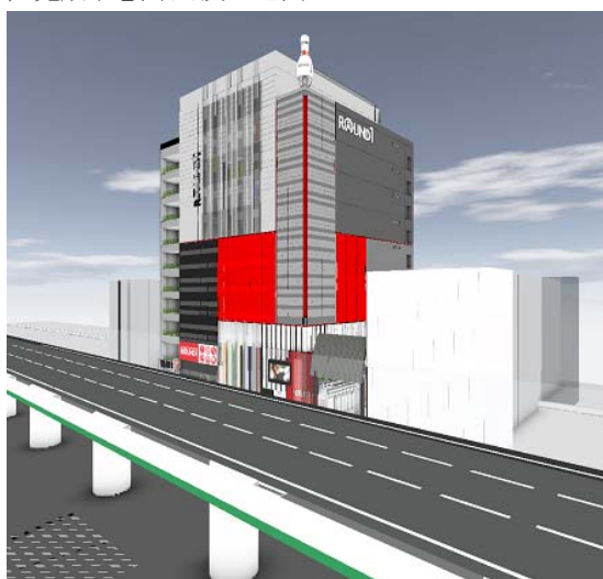
(注)本図は、竣工予定の建物を想定して作成した完成予想図であり、実際とは異なる場合があります。